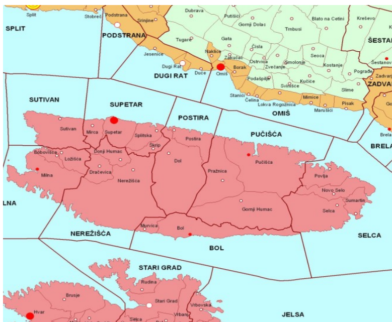
Slika 1. Položaj Općine Pučišća