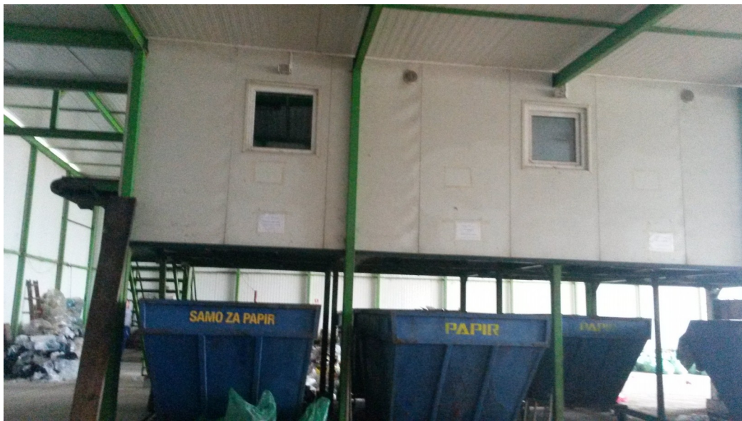
Slika 2. Sortirnica u Gornjem Humcu

U 2012. godini kada je sortirnica započela sa radom od preuzetog otpada 50 do 66 % miješanog komunalnog i glomaznog otpada je manje odložano na odlagalište Košer.